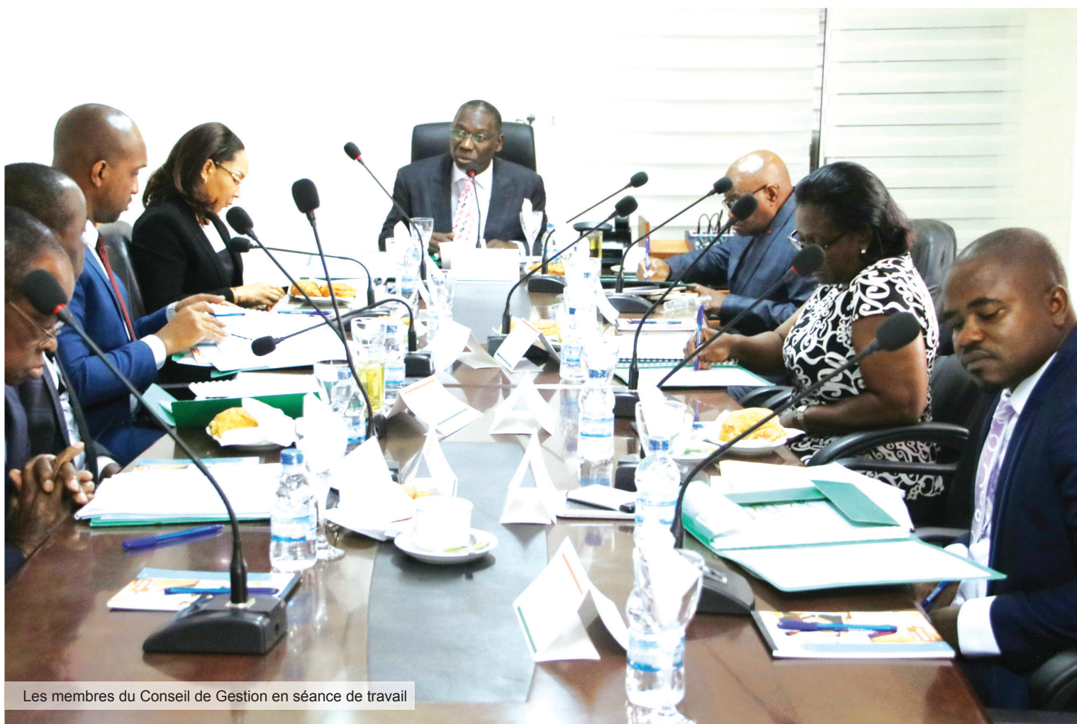
Les membres du Conseil de Gestion en séance de travail

A fin de mener à bien les missions qui lui sont assignées, l'Agence Nationale de Gestion des Déchets (ANAGED) a tenu son premier Conseil de Gestion, le mercredi 04 juillet 2018, dans la salle de réunion de ladite structure.