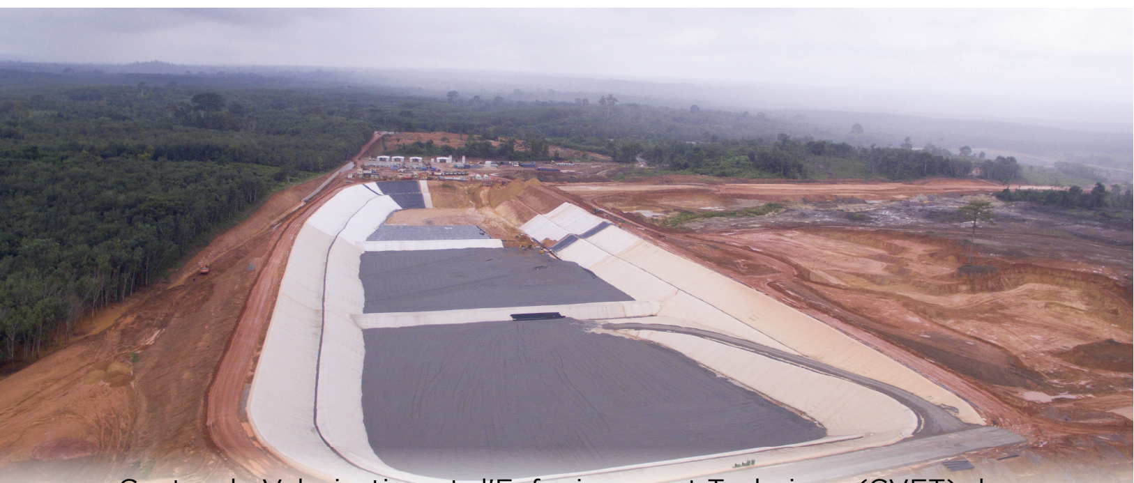
Centre de Valorisation et d'Enfouissement Technique (CVET) de Kossihouen : un centre moderne de traitement des déchets