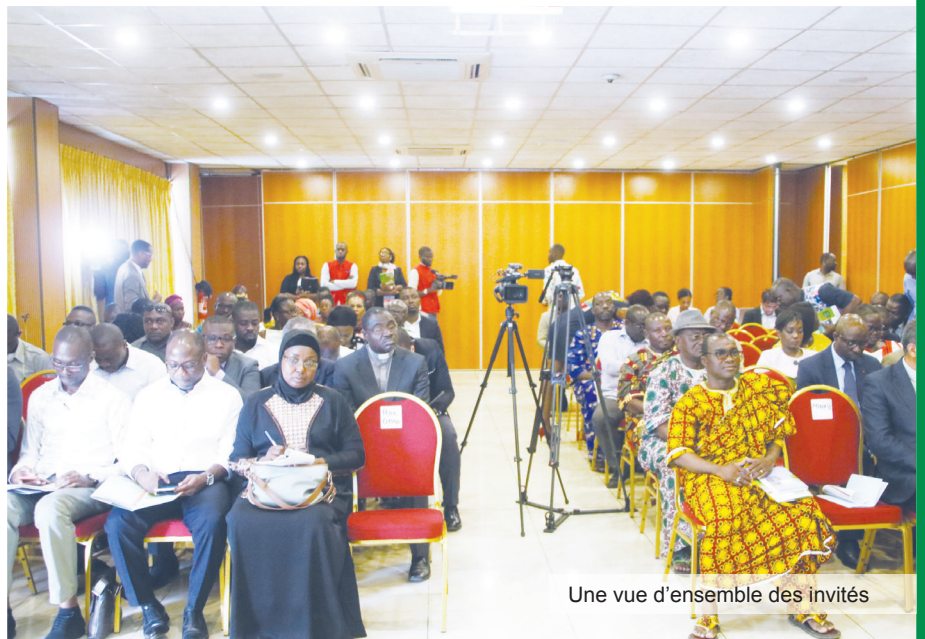
Une vue d'ensemble des invités

S'agissant des opérations de collecte des déchets, le Ministre a informé l'assistance du recrutement de nouveaux opérateurs de collecte à savoir ECOTI .SA et ECO EBURNIE sélectionnés à l'issue d'un appel d'offre International. Ces opérateurs prendront service en novembre prochain. Ce sont 350 camions de collecte et 650 coffres flam-bants neufs mobilisés pour assurer un