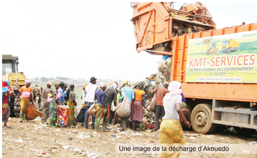
Une image de la décharge d'Akouédo