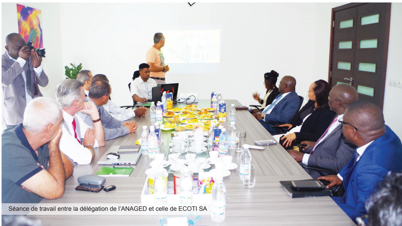
Séance de travail entre la délégation de l'ANAGED et celle de ECOTI SA