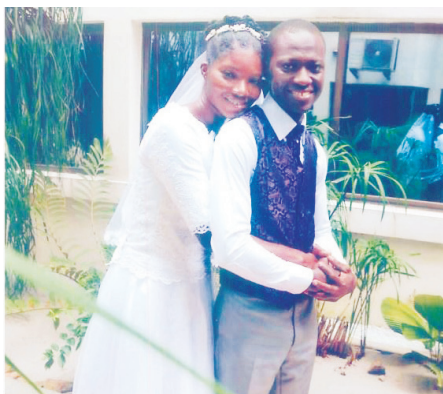
Le couple SECRE