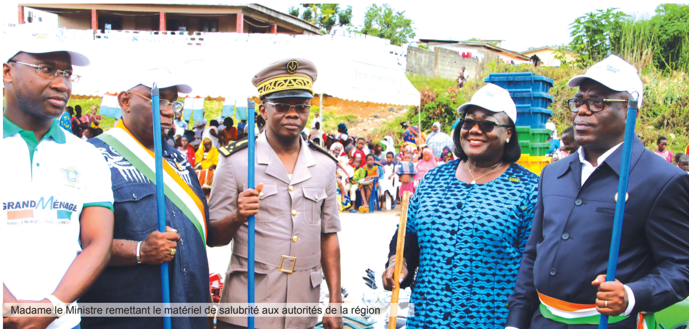
Madame le Ministre remettant le matériel de salubrité aux autorités de la région

D ans le cadre de la mise en œuvre de la politique générale de lutte contre l'insalubrité dans les villes et communes de Côte d'Ivoire, Madame Anne-Désirée OULOTO, Ministre en charge de l'Assainissement et de la Salubrité et fille de la région, a choisi Toulépleu, ville située à l'ouest de la Côte d'Ivoire, à environ 700 kilomètres d'Abidjan, pour le lancement officiel de la 18 ème édition de l'opération « Grand Ménage », le samedi 04 août 2018.