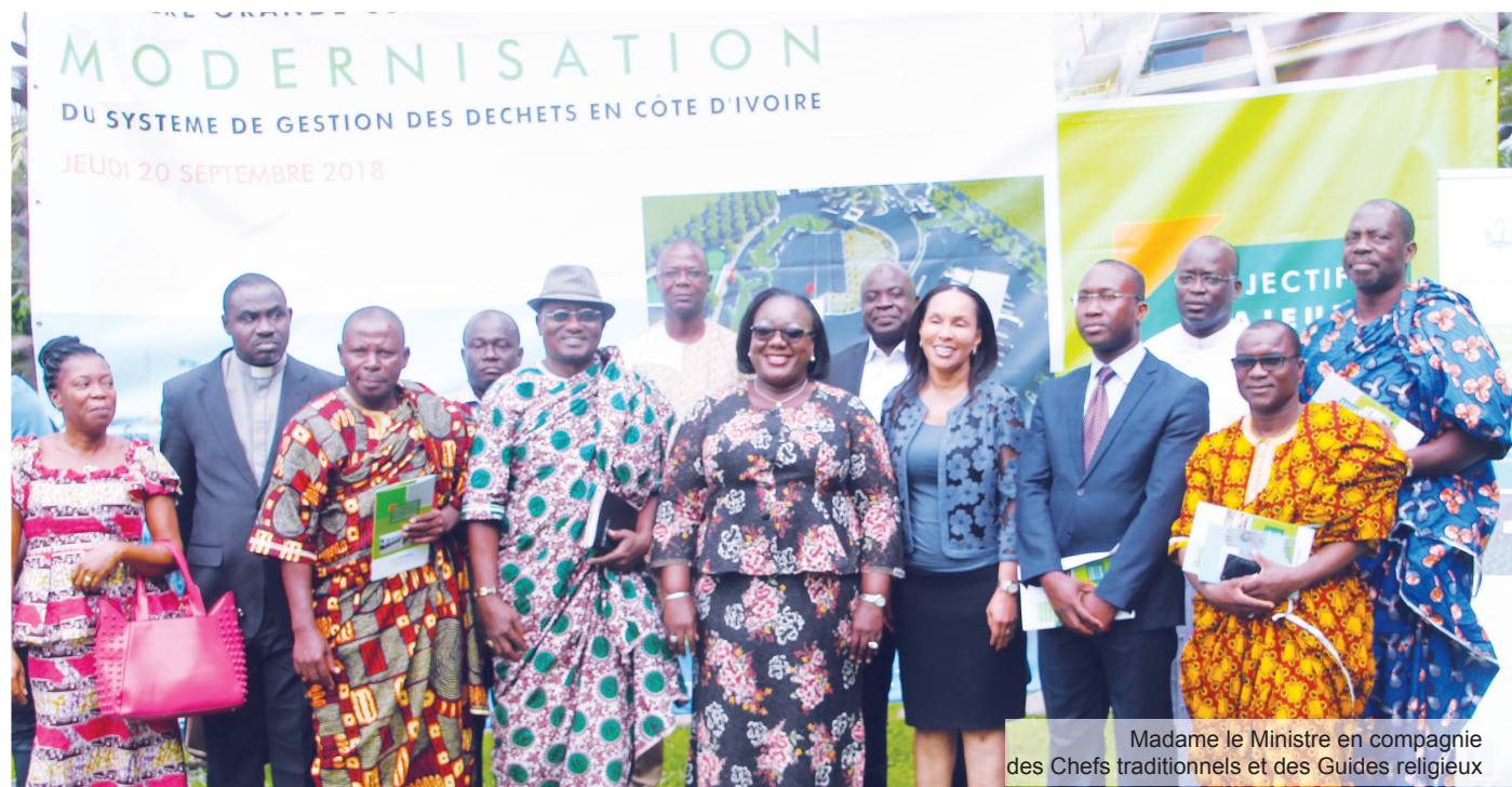
Madame le Ministre en compagnie des Chefs traditionnels et des Guides religieux