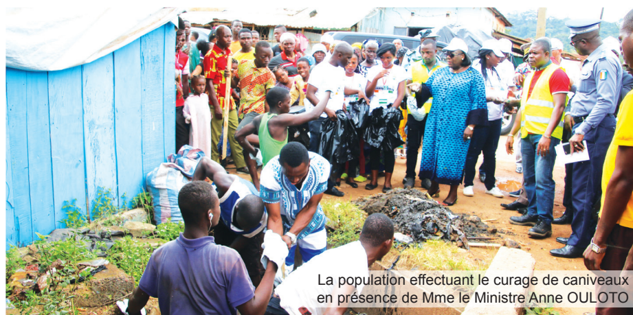
La population effectuant le curage de caniveaux en présence de Mme le Ministre Anne OULOTO