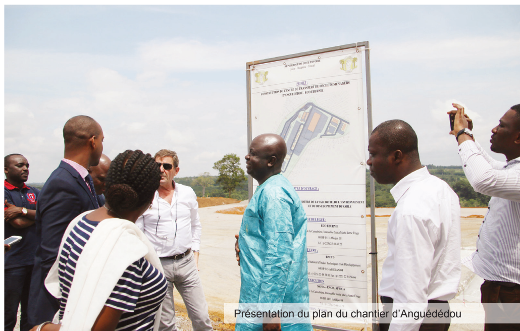
Présentation du plan du chantier d'Anguédédou