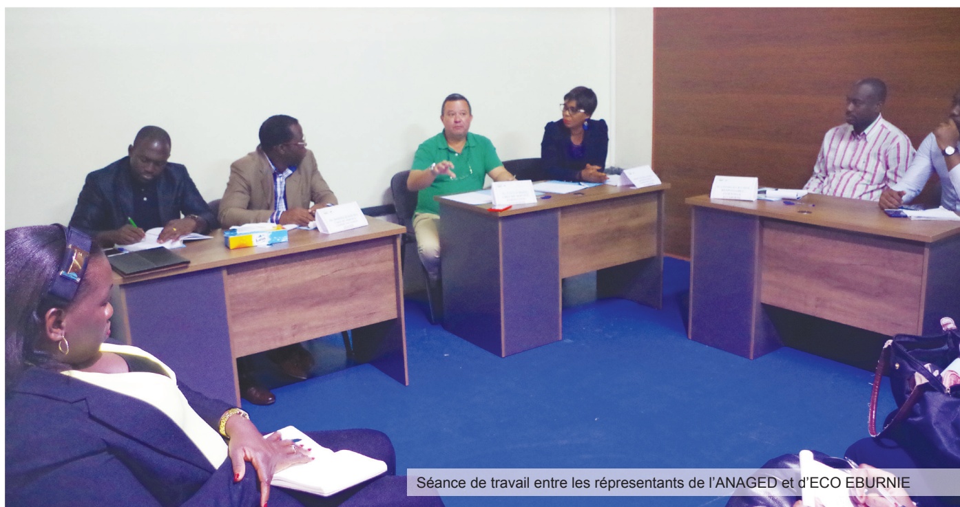
Séance de travail entre les représentants de l'ANAGED et d'ECO EBURNIE

D ans le cadre de la bonne conduite de sa politique de lutte contre l'insalubrité, l'Agence Nationale de Gestion des Déchets (ANAGED), par le biais de sa Direction de la Communication et des Relations Extérieures, a eu une séance de travail avec la Direction de la Formation et de la Communication de la nouvelle entreprise de collecte ECO EBURNIE, un nouvel opérateur dans le secteur de la salubrité. Cette séance de travail a eu lieu le mercredi 1 er août 2018, dans les locaux dudit opérateur, sis à la zone industrielle de Yopougon.