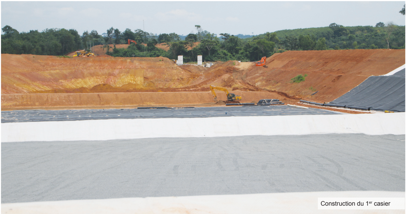
Construction du 1 er casier